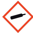
Gas unter Druck